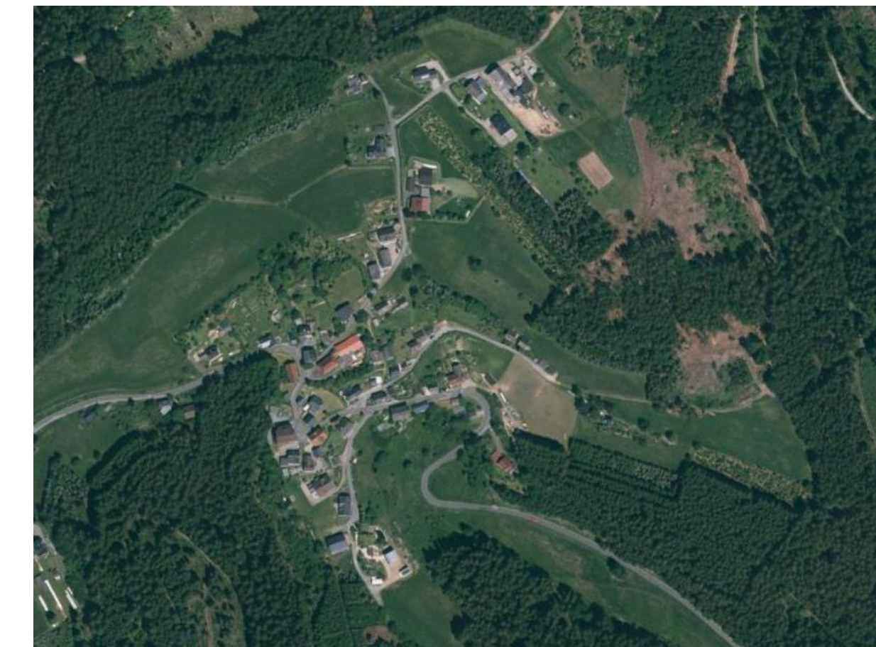
Luftbild ohne Maßstab mit Geltungsbereich